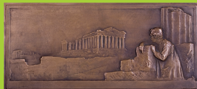
Stanislav Sucharda Architekt / Architect, 1899 bronz / bronze