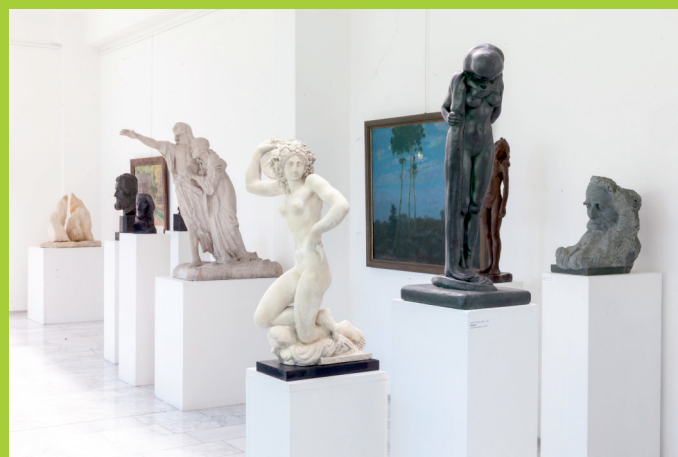
Stálá expozice českého sochařství 1. poloviny 20. století Permanent exhibition of czech sculpture of the first half of the 20th Century

Výjimečný charakter přírodně-uměleckého areálu dotváří interiérové sbírky Galerie plastik. Svým založením v roce 1908 patří hořická galerie k nejstarším sochařským muzeím ve střední Evropě. Uměleckohistoricky cenná díla jsou umístěna v budově postavené dle návrhu architekta Jindřicha Maliny v polovině 70. let 20. století. Galerie se pyšní především pozoruhodnou kolekcí autorských sádrových plastik a soch v ušlechtilých materiálech. Nalezneme tu díla snad všech zakladatelských osobností českého moderního sochařství – Václava Levého, Josefa Václava Myslbeka, Ladislava Šalouna, Josefa Mařatky, Jana Štursy, Bohumila Kafky, Ladislava Jana Kofránka, autorů tvořících v meziválečném období, a mnohých dalších. Sochařskou expozici doplňují krajomalby z počátku 20. století od Františka Kavána, Antonína Hudečka, Antonína Kalvody, Bohuslava Dvořáka aj. a monumentální historická malba hořického rodáka Petra Maixnera. Vedle stálé expozice nabízí galerie bohatý výstavní program zaměřený na uměleckohistorické projekty i současné umění a řadu edukačních programů pro děti i širokou veřejnost.