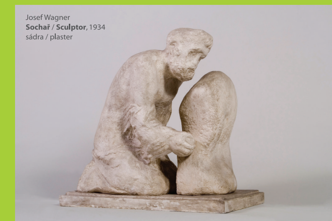
Josef Wagner Sochař / Sculptor, 1934 sádra / plaster

The extraordinary character of the natural-artistic complex is enhanced by the interior collections of the Sculpture Gallery. Founded in 1908, the Hořice Gallery belongs to the oldest sculpture museums in Central Europe. Precious works of art very important for art history are kept in a building constructed by the design of the architect Jindřich Malina in the mid-1970s of the last century. The gallery boasts a remarkable collection of author plaster sculptures and sculptures in noble materials. We can find there the works of almost all the leading founders of Czech modern sculpture - Václav Levý, Josef Václav Myslbek, Ladislav Šaloun, Josef Mařatka, Jan Štursa, Bohumil Kafka, sculptors working in the interwar period and many others. The exposition of sculptures is complemented by landscape paintings from the beginning of the 20th century by František Kaván, Antonín Hudeček, Antonín Kalvoda etc. and monumental historical painting by the native of Hořice, Petr Maixner. In addition to the permanent exhibition, the gallery offers a rich exhibition program focusing on art history projects, contemporary art and also on numerous educational programs for children and general public.