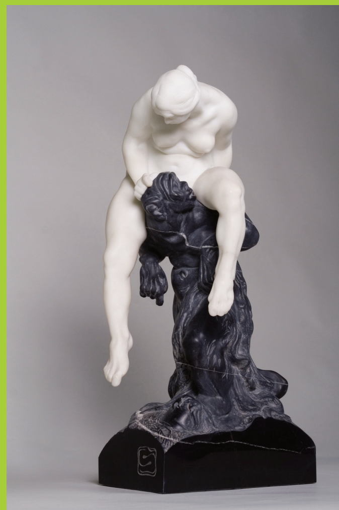
Ladislav Šaloun Čert a Káča / Devil and Káča, 1917 kararský a kosofský mramor / black and white marble