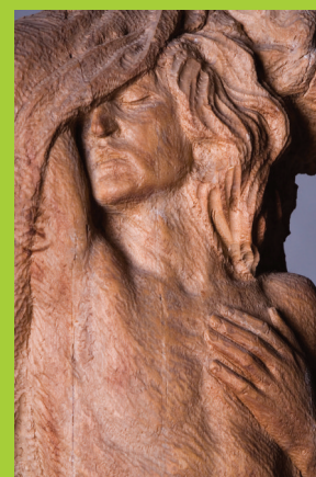
František Bílek Kdo píše naše dozpívá...? Who will sing our songs to the end...?, detail, 1921 dřevo / wood